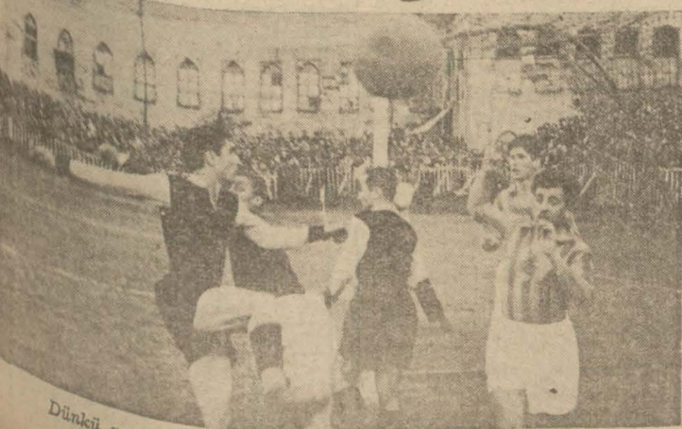
Dünkü maçta, Galatasaray kaleisi önünde heyecanlı bir vaziyet (Yazısı 7 inci sayfamızdadır.)