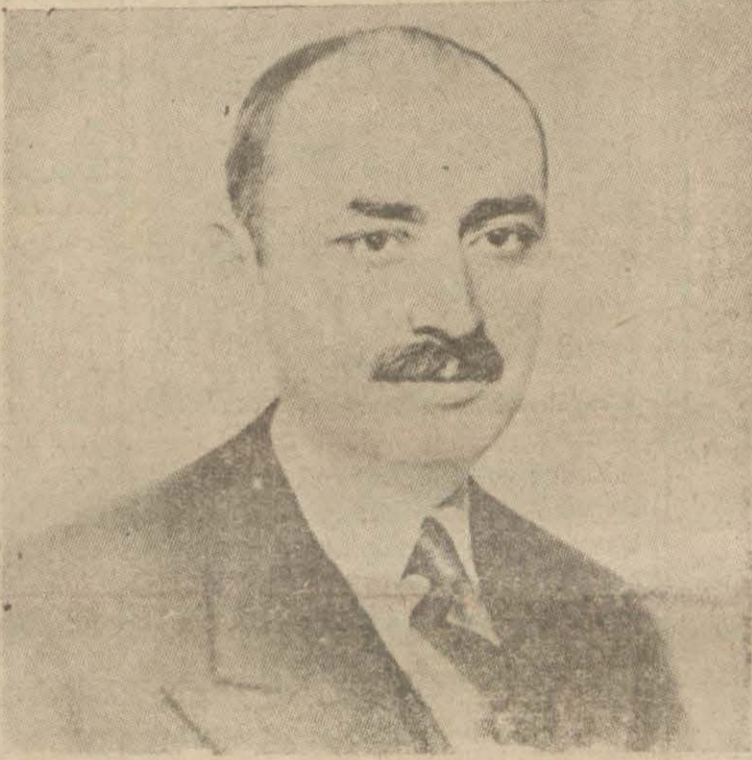
İktisad Vekili Şakir Kesebir

Başvekil Yalovada gazeteci arkadaşlarına hayat şartlarını ucuzlatmak etrafındaki meseleleri izah buyurdular. Hayatın dar eden meselelerin birer birer bir şekli halle bağlanması metlerden bulunuyor. Korunma komisyonu yeni teşekkül ediyor. Bu sene idhal edilecek şeker miktarı 50 bin ton radde-sindedir. (Devamı 8 inci sayfanın 4 üncü ve 5 inci sütunlarında)