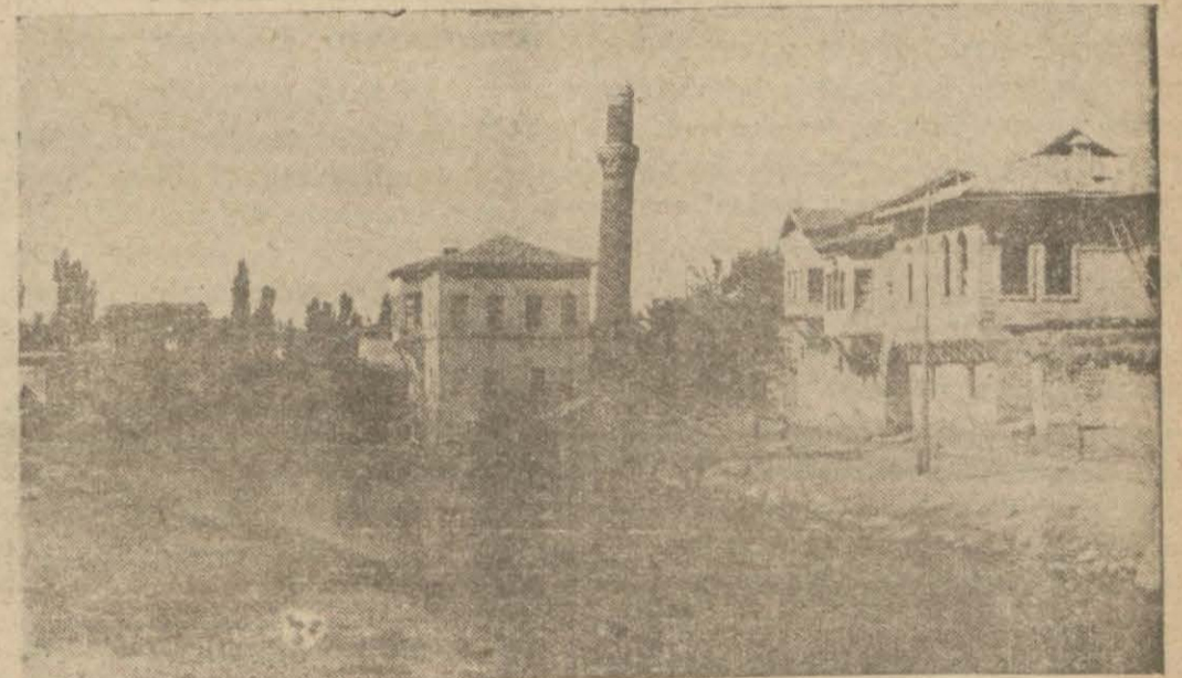
Yeni kömür madeni bulunan Aksaraydan ovr görünüş

Köylüler buldukları kömür damarından şimdiden istifadeye başladılar, nünuneler Vekâlete gönderildi